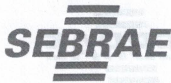
TABELA DE CLASSIFICAÇÃO DAS PROPOSTAS - PREGÃO PRESENCIAL N.º 020/2017